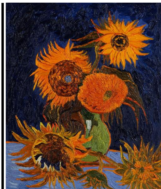
Винсент Ван Гог «Подсолнухи»