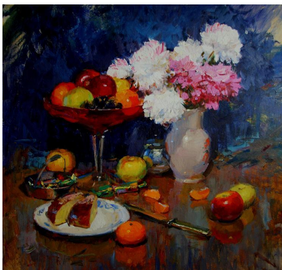
Сергей Свиридов «Натюрморт с хризантемами»