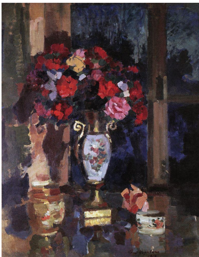
К. Коровин «Бумажные розы»